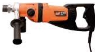
PERFORATRICE SPIT SD 17P