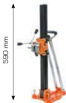
BASE COLONNA SPIT TRIX 160