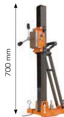
BASE COLONNA SPIT TRIX 250