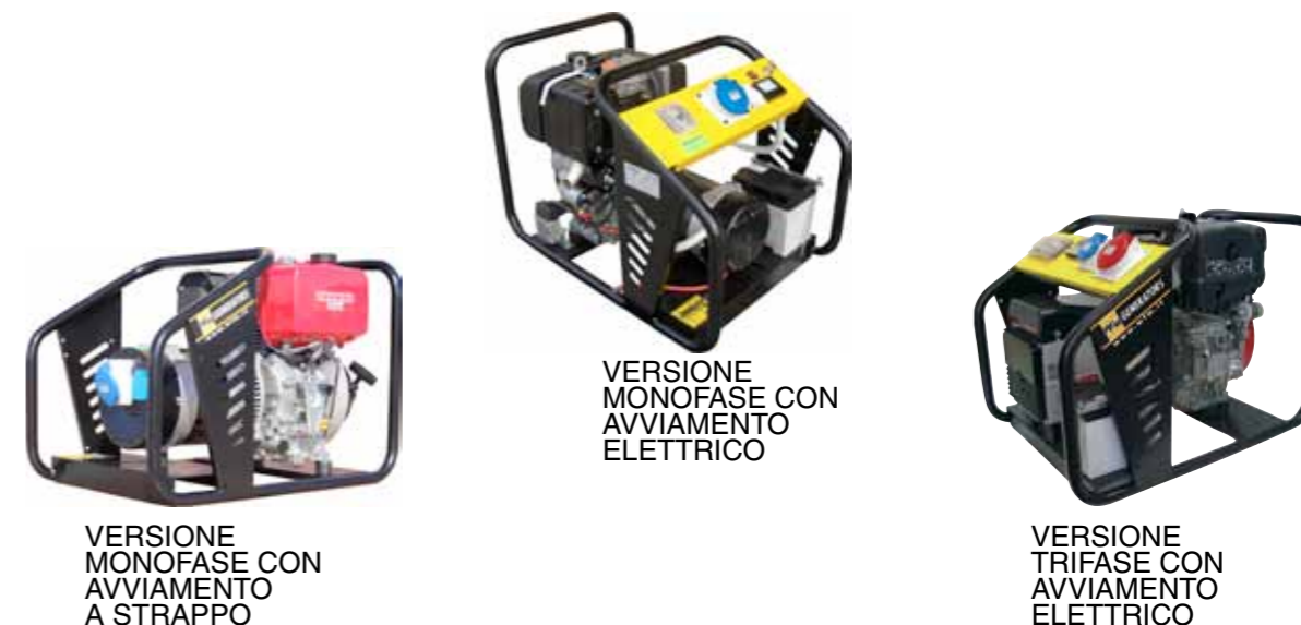
VERSIONE MONOFASE CON AVVIAMENTO A STRAPPO