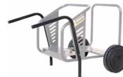
carrello per spostamento manuale (cod. 09060)