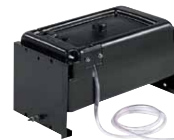
serbatoio da 20 lt. per fissaggio a parete (cod. 09085) (elimina quello di serie a bordo gruppo)